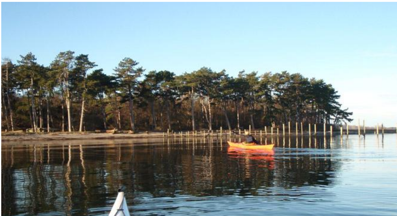
Bognæs skov Tuse Næs 23. december 2008

Dertil vi der komme tilbud om redningsøvelser i koldt vand, følg med i Hammerkrogens Facebookgruppe